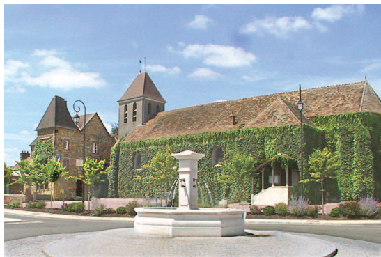
Village du Eurepois